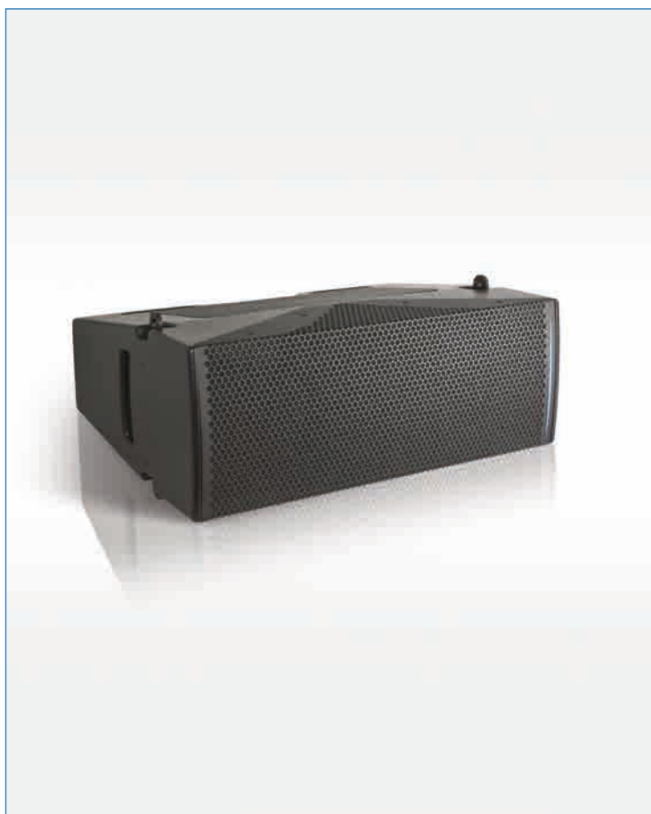
Enceinte compacte "line array" UC206N

Le système Uniline Compact est un système « line array » modulaire basé sur le même concept que le système Uniline. Il se compose de trois enceintes UC206N, UC206W et UC115B. Grâce à sa modularité acoustique et mécanique quasi illimitée, il convient aux applications de courte et moyenne portée, dans les cas d'utilisation pour lesquels la compacité, la discrétion et la praticité du système s'imposent.