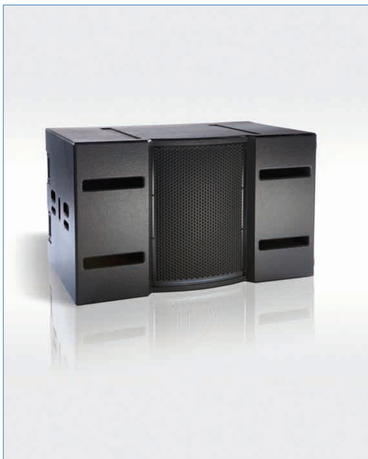
Enceinte d'infra basse TB218S

Le "subwoofer" TB218S est une enceinte de basses et d'infra basses de nouvelle génération alliant hautes performances acoustiques à une ergonomie répondant aux exigences des exploitants professionnels.